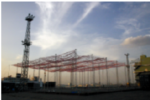
横浜トリエンナーレ2005